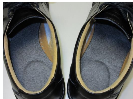
左足側をカットしてブーツに挿入