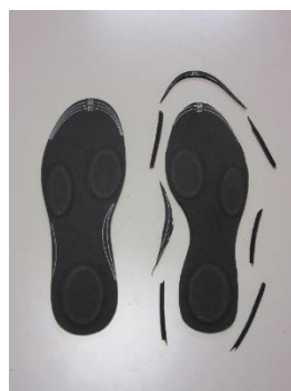
左足側をカットした映像